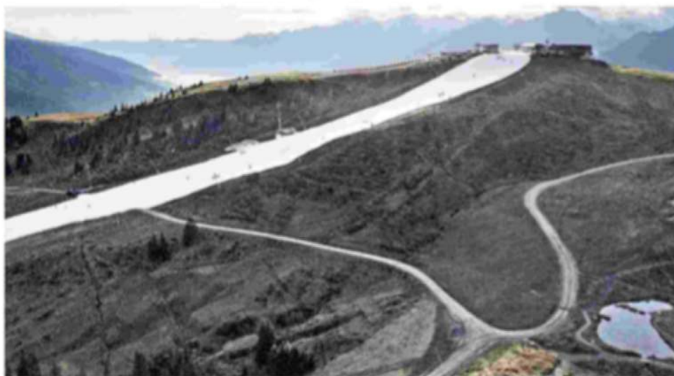
▲ Dal drone La pista da sci di Resterhöhe, vicino Kitzbühel, con la neve conservata dallo scorso anno

In Austria montagne brulle e piste pronte. Proteste ambientaliste