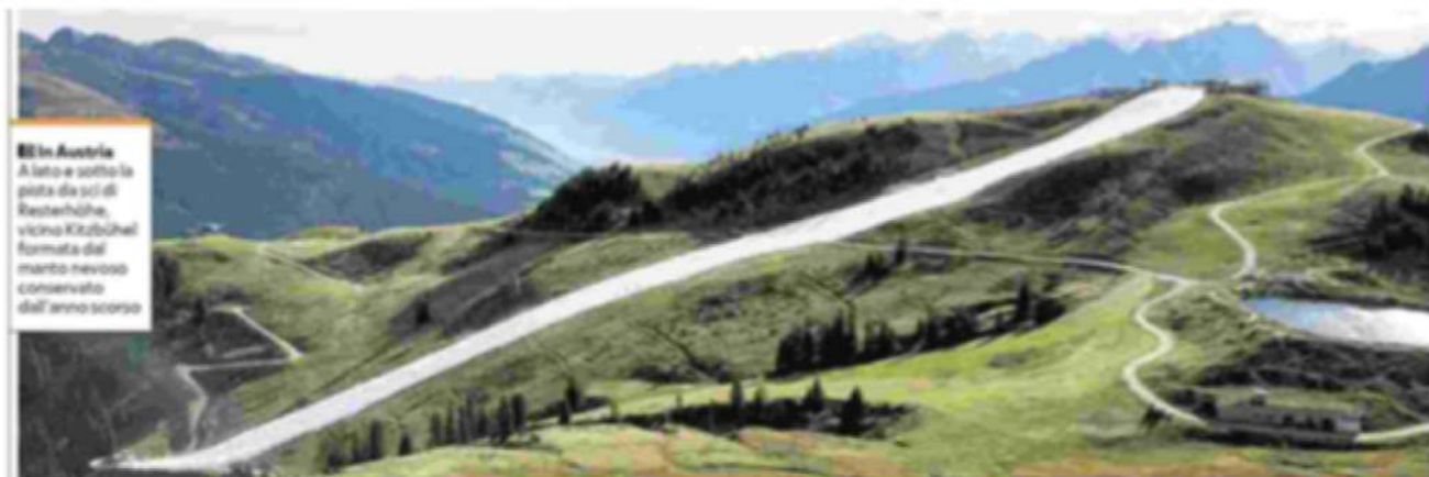
■ In Austria A lato e sotto la pista da sci di Besterhöhe, vicino Krüschel formata dal manto nevoso conservato dall'anno scorso